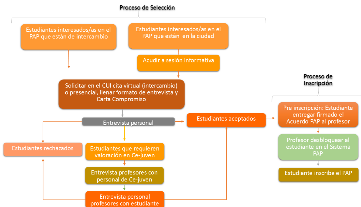
Diagrama 4. Proceso de selección e inscripción de estudiantes

El proceso de selección incluye entrevistas con los profesores PAP, en las que se aclaran los objetivos y la forma de operar del PAP CUI. También se realiza un primer filtro para identificar si las y los aspirantes cumplen con el perfil profesional y personal que requiere el PAP CUI. Posteriormente, se orienta a las y los estudiantes a quienes se ha admitido para que se den de alta y realicen su trámite en el sistema de inscripción del alumnado. El diagrama 4 presenta un breve esquema de este proceso.