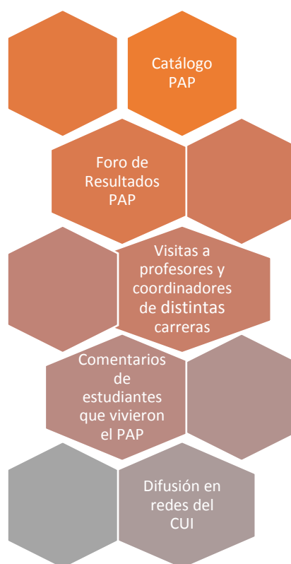
Diagrama 3. Medios de difusión del PAP

El Diagrama 3 presenta los distintos medios por en los que el PAP CUI se da a conocer a estudiantes interesados/as, de estos, la Sesión Informativa y el Foro de resultados PAP son mecanismos institucionales, que forman parte del proceso PAP.